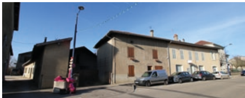
Futur emplacement de la bibliothèque

La municipalité travaille actuellement sur le transfert de la bibliothèque qui s'implantera sur le site des Tilleuls. Les négociations sont en cours avec l'opérateur qui aura la charge de réaliser ce projet qui accueillera, outre la nouvelle bibliothèque multimédia, des commerces en rez-de-chaussée et des logements. L'objectif est que cet équipement soit un lieu d'échange entre art, culture, loisirs et sciences, où jeunes et moins jeunes y trouveront le plaisir de lire, des expositions curieuses et intéressantes, des stages divers, des formations informatiques de qualité, des jeux en ligne, des rencontres avec des auteurs, des conteurs, des petits spectacles... La commune souhaite que ce lieu soit accessible,