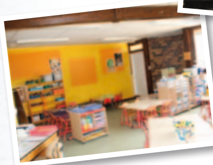
L'école maternelle compte une nouvelle classe depuis 2014.