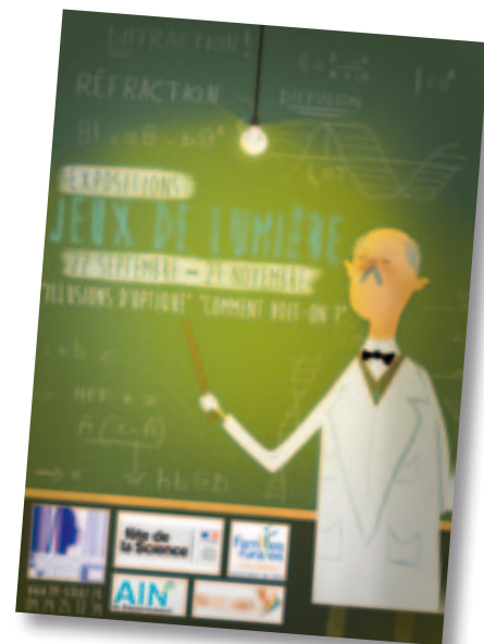
Les écoliers ont participé à la fête de la Science, sur le thème de la lumière.

bibliothèque et le centre de loisirs de l'association Familles rurales. Le soir, à la salle des fêtes, expositions, jeux, expériences et spectacle de magie ont permis de découvrir les différents phénomènes autour de la lumière et des ombres.