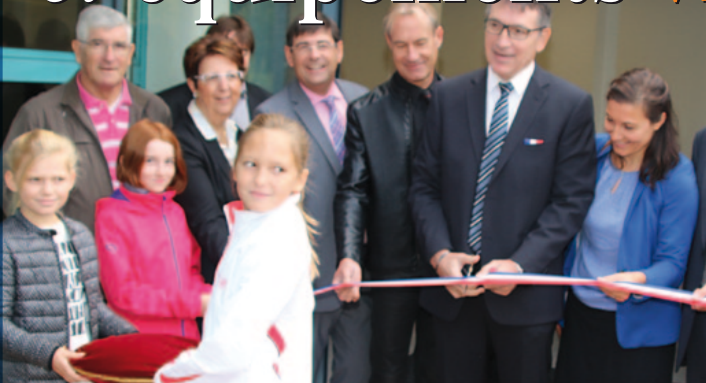
L'école maternelle Les Sources agrandie en 2014 a été inaugurée le 19 septembre 2015.

Les attributions de la mairie en tant que collectivité territoriale sont multiples : état civil, urbanisme et logement, écoles et équipements, activités culturelles, santé et aide sociale, police administrative... Zoom sur les nouveaux équipements et les services qui évoluent pour satisfaire aux besoins de tous les Viriat.