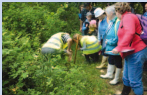
Sortie « nature » en famille organisée par le centre de loisirs avec la Société de chasse de Viriat.

Avec la rentrée des classes, le centre de loisirs a de nouveau ouvert ses portes pour accueillir les enfants de Viriat sur le temps périscolaire, les mercredis après-