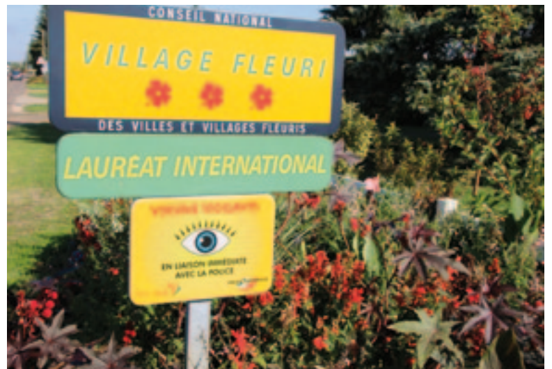
Vingt-cinq panneaux rappelant l'engagement de Viriat dans le dispositif de participation citoyenne « Voisins vigilants » ont été implantés dans divers quartiers.