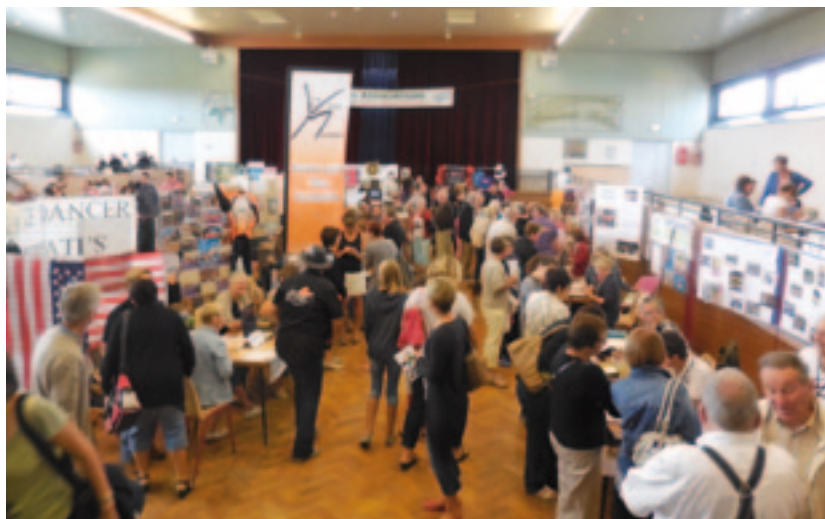
Trente et une associations ont participé au forum 2015.