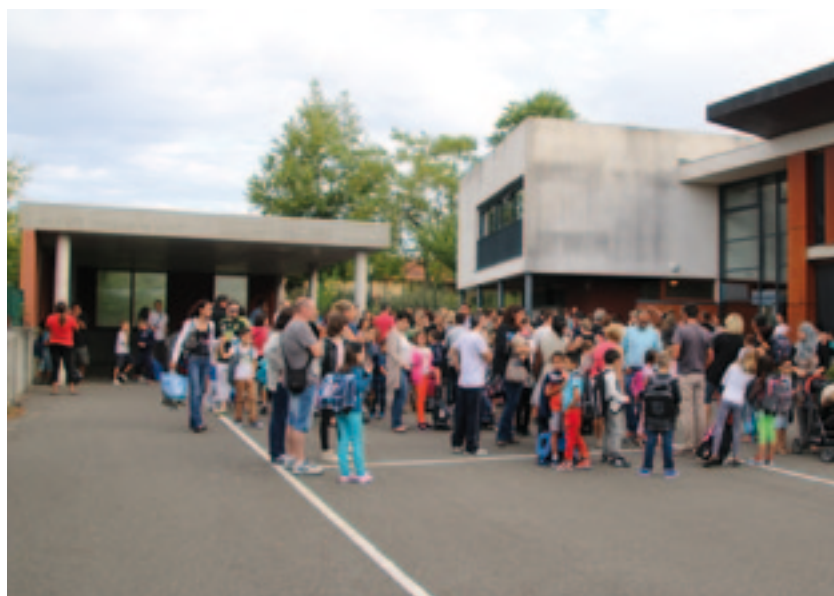
Cette année, 660 enfants ont fait leur rentrée à Viriat.