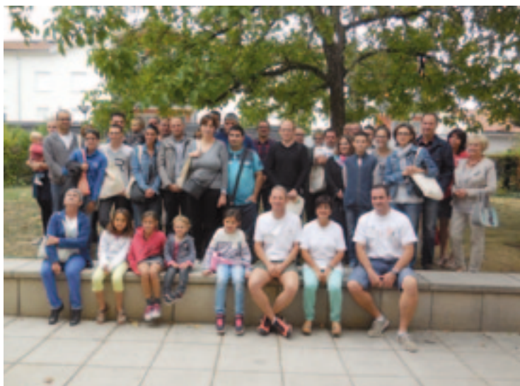
Bienvenue aux nouveaux arrivants à Viriat.