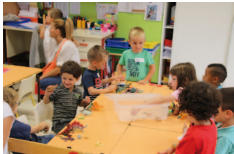
À l'école maternelle, 155 élèves sont répartis sur six classes.

Les temps d'activités périscolaires (Tap) évoluent. Deux fois une heure trente d'activités gratuites sont proposées cette année dans chaque école, les mardis et vendredi après-midi. Le mardi, les élèves de CP, CE1 et CE2 bénéficient d'initiations culturelles et sportives. Handball, danse,