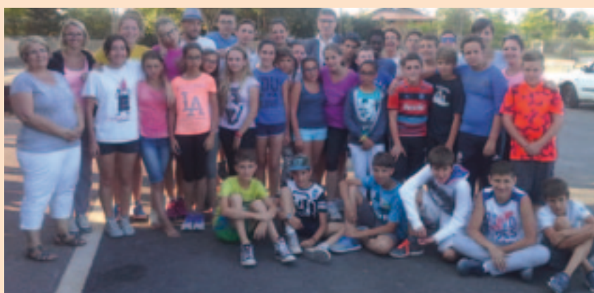
Cet été, treize enfants de Sorbolo et treize de Viriat ont partagé un séjour sportif à Viriat.

Du 5 au 11 juillet, treize enfants de 11/13 ans, de Sorbolo (Italie), ont séjourné à Viriat dans le cadre