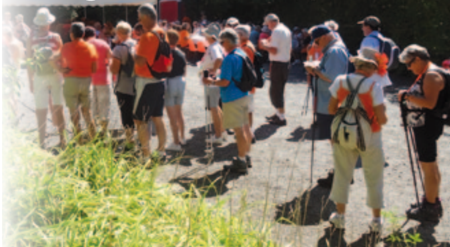
L'édition 2015 avait pour thème : « Tous en orange ».