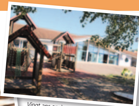
Vingt ans après sa construction, la Cité des enfants mérite bien un rafraîchissement...