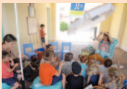
La bibliothèque a convié à des « histoires sous les parasols » en juillet.