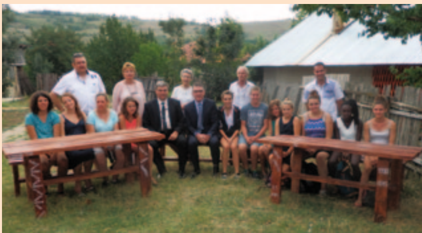
Cet été, onze jeunes Viriatistes ont vécu dix jours à Voinesti (Roumanie) et aménagé un espace de rencontres pour les habitants du village.

très rudimentaire, des familles qui les hébergeaient. « Ils ont participé aux travaux de la maison et se sont rendu compte qu'avec moins de choses que nous, les villageois étaient quand même heureux. » ■