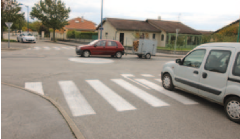
Le chemin du Quartier Jayr a été sécurisé.

Début septembre, un tronçon du chemin du Vieux-Fleyriat a été rénové. Cet automne, au hameau